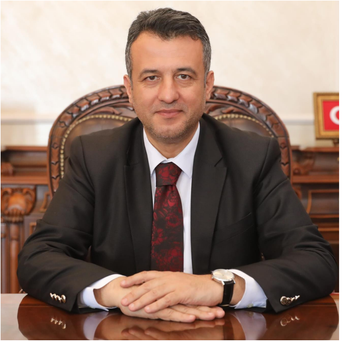
Halit DOĞAN Samsun Büyükşehir Belediye Başkanı