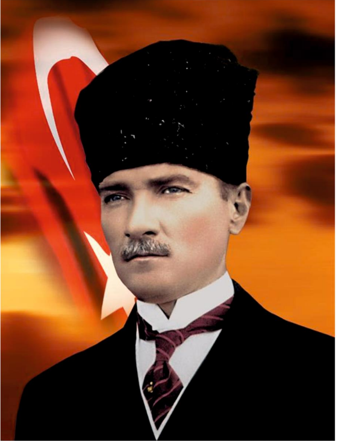
Gazi Mustafa Kemal ATATÜRK